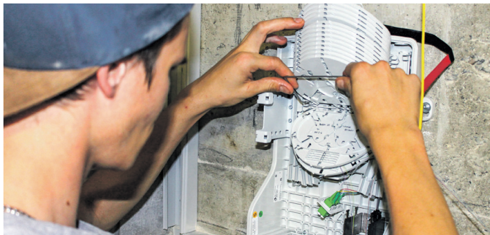
Bis Ende Jahr ist voraussichtlich rund die Hälfte des Gemeindegebietes mit einer Glasfaseranschlussdose ausgerüstet.

Die ComNet Fulenbach AG realisiert ein sogenanntes «offenes» Glasfasernetz. Aktuell sind auf dem Glasfasernetz die bekannten Angebote des Signallieferanten «Quickline» erhältlich. Zukünftig sollen aber verschiedene Signallieferanten das Glasfasernetz benutzen können und die Einwohnerinnen und Einwohner sowie Gewerbebetriebe in Fulenbach so ihren gewünschten Anbieter für Glasfaser-Internet, TV und Telefonie frei wählen können.